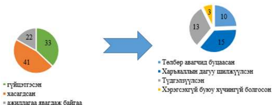
График 3. Гадаад улсын арбитрын шийдвэрийн биелэлтийн байдал (2011-2024)

ажиллагаанаас хассан /төлбөр авагчид буцаасан, хэрэгсэхгүй буюу хүчингүй болсон, харьяаллын дагуу шилжүүлсэн, түдгэлзүүлсэн/ байна. (График 2-с үзнэ үү)