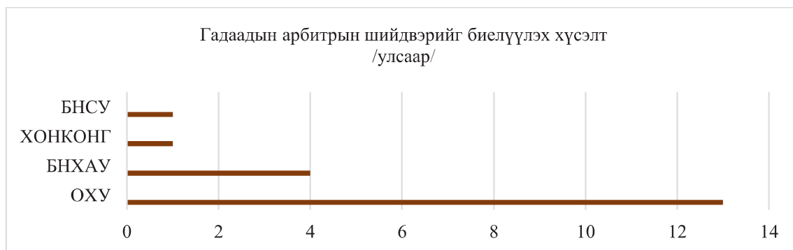
График 4. Нийслэлийн 9 дүүргийн иргэний хэргийн анхан шатны шүүхээс гадаад улсын арбитрын шийдвэрийн биелэлтийг баталгаажуулсан байдал (2019-2023)

Улсаар ангилбал, ОХУ-ын арбитрын 13, БНХАУ-ын арбитрын 4, Хонконгийн арбитрын 1, БНСУ-ын арбитрын 1 шийдвэрийг баталгаажуулах хүсэлт гаргажээ. Баянзүрх дүүргийн Иргэний хэргийн анхан шатны шүүхээс ирүүлсэн мэдээлэлд улсаар ангилсан мэдээлэл тусгагдаагүй байна.