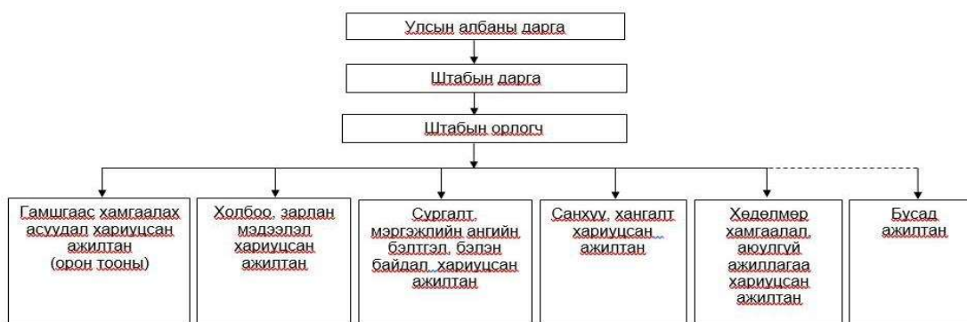
Зураг-1. Гамшгаас хамгаалах улсын албаны удирдлага, бүрэлдэхүүнийг харуулсан зураглал

Харин Гамшгаас хамгаалах Сурталчилгааны албаны төлөвлөгөөнд сурталчилгааны ажлын албаны дарга нь Засгийн газрын эрхлэх газрын дарга, штабын даргаар Засгийн газрын Хэвлэл мэдээлэл, олон нийттэй харилцах газрын дарга байна. Засгийн газрын 2022 оны 12 дугаар сарын 21-ний өдрийн 475 дугаар тогтоолоор Засгийн газрын Хэрэг эрхлэх газрын бүтцэд Хэвлэл мэдээлэл, олон нийттэй харилцах газар хамаардаг болсон. Тус газар нь үг, илтгэлийн хэлтэс, цахим мэдээллийн хэлтэс, сонин, хэвлэлийн хэлтэс, контент боловсруулах хэлтэс, гадаад, мэдээ, сурталчилгааны хэлтэс, иргэд, олон нийттэй харилцах 11-11 төв гэсэн бүтэцтэйгээр үйл ажиллагаа явуулж